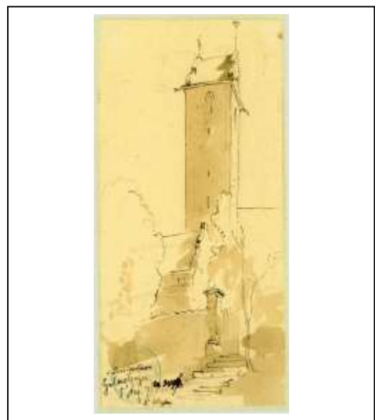
Gemälde von K. Weyser 1876

Der Kirchturm stand an derselben Stelle wie bei der heutigen Kirche. Der Eingang war allerdings von Westen, und der Chor befand sich auf der Seite des Kirchturms. Die Kirche hatte eine Länge von ca. 25m, und das Kirchenschiff eine Breite von ca. 9m. Die Bänke reichten vom Mittelgang von vermutlich 1,50m Breite bis an die Außenwand. In einer Bank fanden dicht gedrängt maximal 6 Personen Platz. Bei ungefähr 300 Seelen fanden grob geschätzt maximal 120-150 Personen einen Platz.