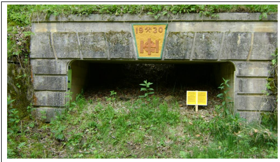
Mundloch des „Kapfstollens“

Letzte Zeugen des Eisenerzbergbaus sind das Eingangsportale, der Sprengstoffbunker, überwachsene Abraumhalden und der Klärteich, dem heutigen Sportgelände des FC. Gutmadingen.