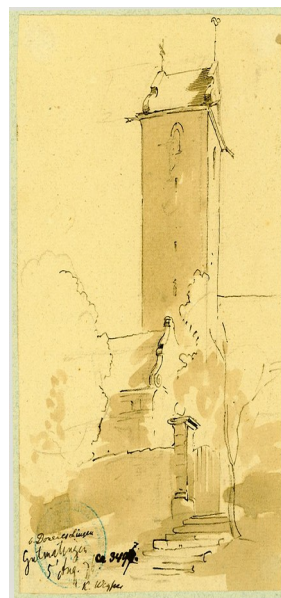
Gemälde von K. Weyser 1876

Der Kirchturm stand an derselben Stelle wie bei der heutigen Kirche. Der Eingang war allerdings von Westen, und der Chor befand sich auf der Seite des Kirchturms. Die Kirche hatte eine Länge von ca. 25m, und das Kirchenschiff eine Breite von ca. 9m. Die Bänke reichten vom Mittelgang von vermutlich 1,50m Breite bis an die Außenwand. In einer Bank fanden dicht gedrängt maximal 6 Personen Platz. Bei ungefähr 300 Seelen fanden grob geschätzt maximal 120-150 Personen einen Platz.